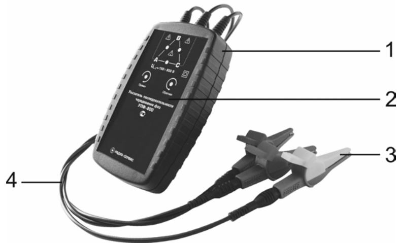
Рисунок 1.4.1 – Внешний вид указателя